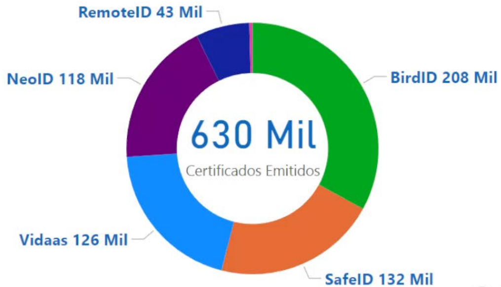
Certificados Emitidos Set/23 - Ago/24