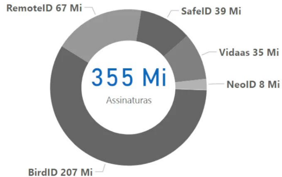
Assinaturas por APP