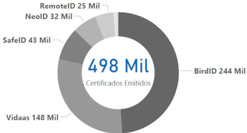
Certificados Emitidos Set/22 - Ago/23